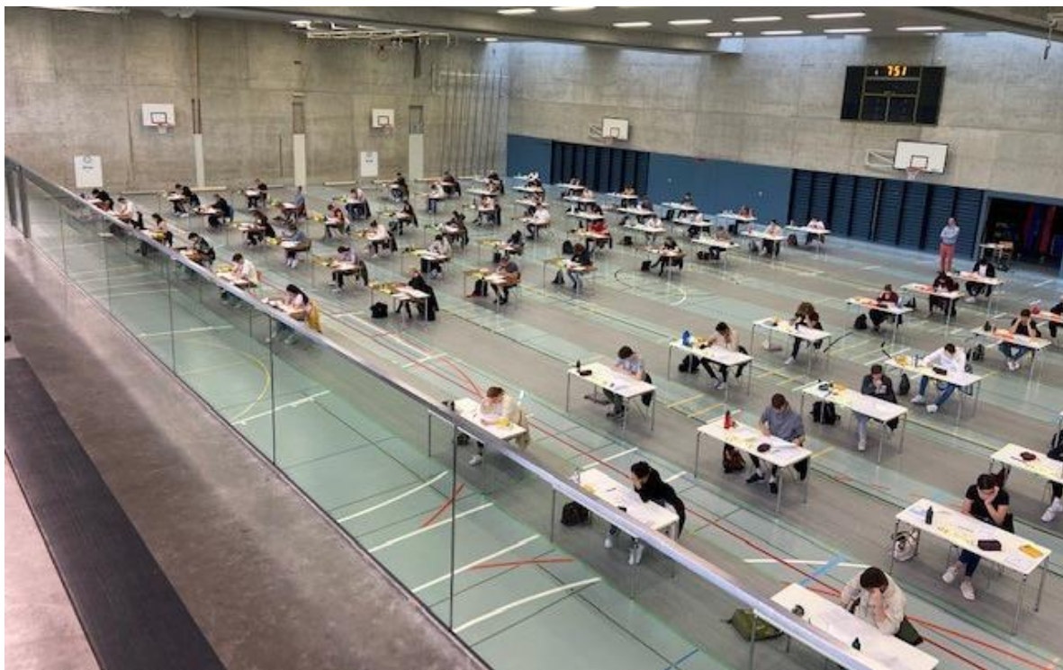
Schriftliche Maturaprüfungen in der Dreifachhalle unter Umsetzung eines umfassenden Schutzkonzeptes.

Der Kanton Thurgau, der vom Bund die Entscheidungskompetenz für die Maturaprüfungen und die Abschlussprüfungen FMS erhielt, führte als einer der wenigen Kantone sowohl die schriftlichen und mündlichen Maturaprüfungen als auch die schriftlichen und mündlichen Abschlussprüfungen FMS durch. Über die Durchführung der Berufsmaturaprüfungen hingegen entschied der Bund: Deshalb legten die Absolventinnen und Absolventen der Handelsmittelschule und der Informatikmittelschule keine Abschlussprüfungen ab.