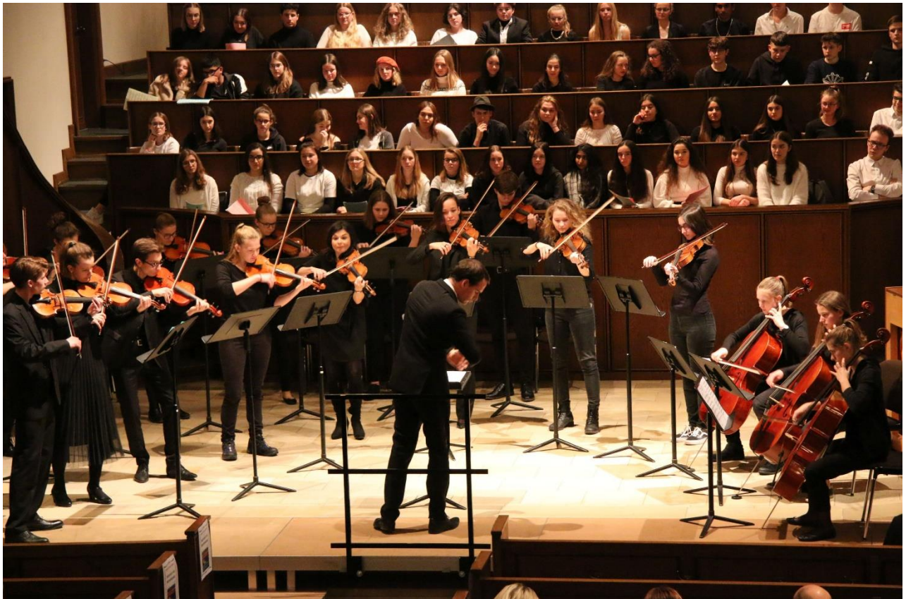
Bild: Weihnachtskonzert 2019