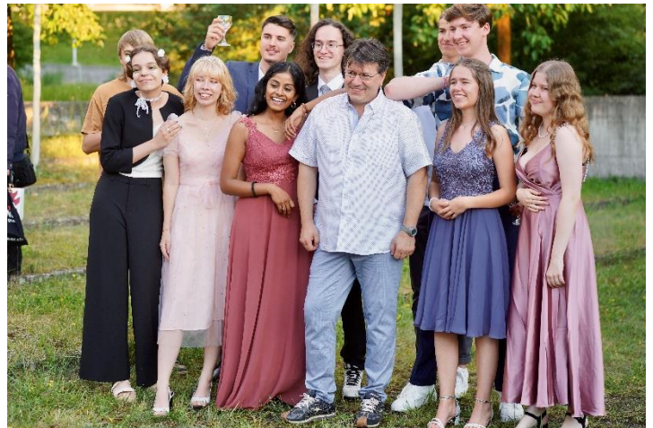
Maturandinnen und Maturanden feiern den erfolgreichen Abschluss nach der Maturafeier gemeinsam mit ihren Lehrpersonen am anschliessenden Apéro.