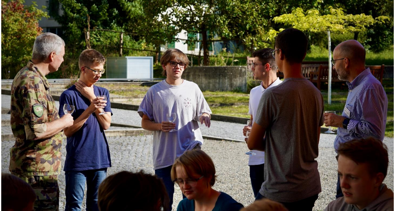
Vertreterinnen und Vertreter aus Politik, Armee und kantonalen Ämtern waren im Rahmen der Sicherheitswoche zu Gast an der Kanti Frauenfeld.

Strafrechtswoche und das Pilotprojekt «Sicherheitswoche». Auftraggeber für die Sicherheitswoche war die Armee. Bearbeitet wurde von den freiwillig am Projekt teilnehmenden Jugendlichen das Szenario «Strommangellage». Durch eigenes Erleben sollten die jungen Menschen für die Sicherheit der Schweiz und ihrer Bevölkerung sensibilisiert werden. Damals noch nicht voraussehbar war die politische Entwicklung in den Folgemonaten und die Geschwindigkeit, mit welcher das Szenario aktuell werden könnte. Die Durchführung führte zu einer eindrücklichen Zusammenarbeit mit sämtlichen Blaulichtorganisationen und zu einer einwöchigen Präsenz hochrangiger Vertreterinnen und Vertreter aus Politik, Armee und kantonalen Ämtern an unserer Schule.