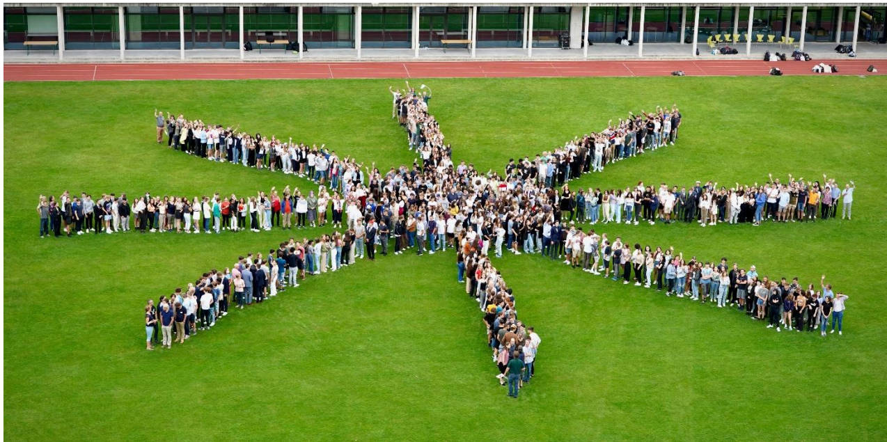
Das «Sünneli» bei der Schuljahreseröffnung

Gibt es ein Schuljahr, in dem alles wie geplant abläuft? Wohl kaum. Unerwartetes und Überraschendes gehören zum Leben und damit auch zum Leben an einer Schule. Im Berichtsjahr mehrten sich jedoch, einmal mehr Corona geschuldet, unerwartete Wendungen. Mit dem Frühjahr 2022 zeigte sich die Symbolkraft des bei der Schuljahreseröffnung durch die Schulangehörigen gebildeten «Sünnelis». Dieses «Sünneli», das medial zerrissen und coronabedingt mit emotionalen Voten kommentiert worden war, strahlte im zweiten Semester über der Schule.