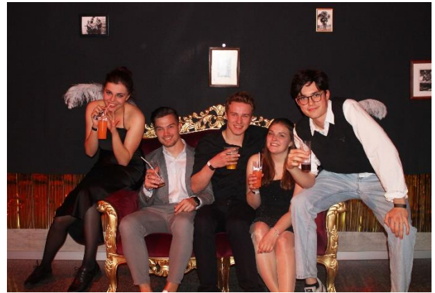
Die Schülerinnen und Schüler der Kanti Frauenfeld feierten ausgelassen.